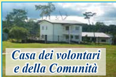
Casa dei volontari e della Comunità