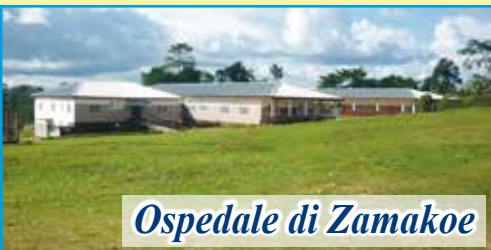
Ospedale di Zamakoe

Dopo la visita al nostro progetto da parte dei responsabili dell'Associazione (giugno 2019) sono stati confermati presso l'Ospedale "NOTRE DAME DE ZAMAKOE" tutti i progetti ed i servizi nati per i più poveri. Ogni giorno è garantita la presenza di medici per le consultazioni e le visite. Per il reparto di chirurgia è stato confermato il medico chirurgo che ormai lavora con noi da anni. Ogni mese sono decine ormai le operazioni chirurgiche. Il nostro impegno mensile per sostenere il progetto è di 1.500 euro