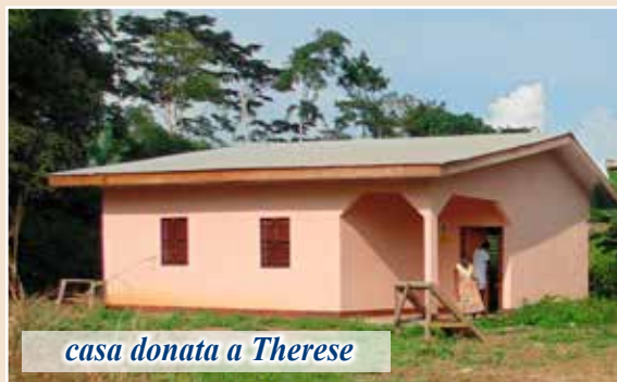
casa donata a Therese