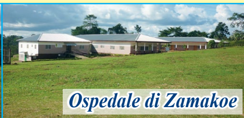
Ospedale di Zamakoe

Dopo la visita al nostro progetto da parte dei responsabili dell'Associazione (novembre 2024) sono stati confermati presso l'Ospedale "NOTRE DAME DE ZAMAKOË" tutti i progetti ed i servizi nati per i più poveri. Ogni giorno è garantita la presenza di medici per le consultazioni e le visite. Per il reparto di chirurgia è stato confermato il medico chirurgo che ormai lavora con noi da anni. Ogni mese sono decine ormai le operazioni chirurgiche. Il nostro impegno mensile per sostenere il progetto è di 1.500 euro necessari