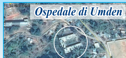
Ospedale di Umden