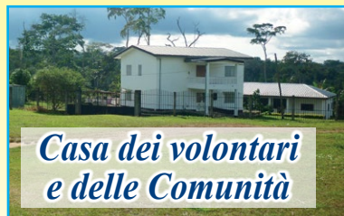
Casa dei volontari e delle Comunità