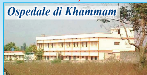
Ospedale di Khammam

In questo povero angolo dell'India, prosegue il nostro aiuto per la costruzione di pozzi d'acqua (ad oggi già scavati 40) e bagni a sostegno dei poveri villaggi della zona. In estate la temperatura arriva anche ai 45°C e la situazione diventa drammatica anche in campo sanitario. Ricordiamo che la somma necessaria per la realizzazione di un pozzo è di 500 euro e di un bagno di 250 euro . Con l'inaugurazione e l'apertura dell'Ospedale Pediatrico "DONO E CAREZZA DELLA MAMMA DELL'AMORE" nel villaggio di Morampally Banjara, dopo aver parlato con il Vescovo, l'associazione propone di "adottare a distanza" i bambini qui ricoverati (tutti sieropositivi o malati di AIDS) proprio per sostenere le spese di gestione, l'assistenza e le cure. Per ogni bambino sostenuto sarà richiesto un contributo annuale di almeno 200 euro .