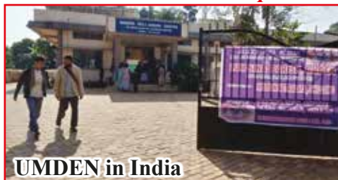
UMDEN in India

Dalle nostre missioni le foto di DICEMBRE con le numerose attività dall'Ospedale di UMDEN (India) e dall'Ospedale di ZAMAKOE (Africa)