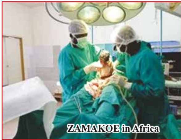
ZAMAKOE in Africa