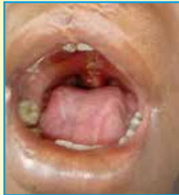
Olive operata nel 2004 al labro ora è stata operata al palato

NOTA: Carissimi amici, nel mese di aprile abbiamo iniziato alcuni lavori, necessari ed urgenti, per la manutenzione straordinaria all'ospedale. È opportuno accogliere i malati ed i poveri in ambienti idonei, quindi, abbiamo dato conferma ad alcuni interventi che avranno una spesa globale di circa 4.500 euro. Chi desidera sostenga la nostra missione e le attività in Cameroun usando i canali a voi più comodi. Grazie per l'aiuto!