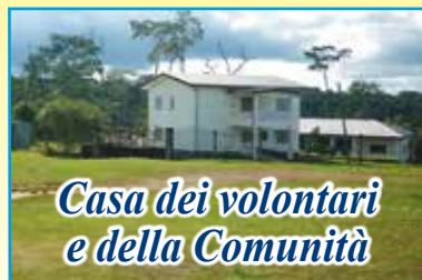
Casa dei volontari e della Comunità