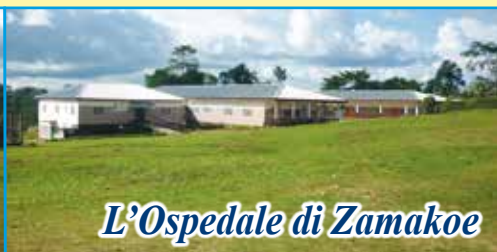
L'Ospedale di Zamakoe