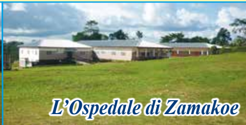
L'Ospedale di Zamakoe