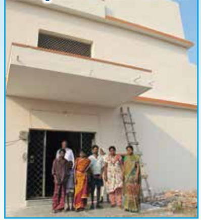
L'Ospedale di Khammam

Vi informiamo che la costruzione del nuovo reparto pediatrico dell'Ospedale nel villaggio di Morampally Banjara prosegue bene. Il Vescovo di Khammam Mons. Paul Maipan ci ha inviato in questi mesi le fotografie inerenti i lavori e noi le abbiamo sempre pubblicate. L'Associazione ha finanziato questo progetto con l'invio (dall'inizio dell'anno 2013 ad oggi) della somma di 60.000 euro . Durante la 5a edizione della festa internazionale delle Oasi nel Mondo (svoltasi a Paratico il 25 maggio 2014) è stato annunciato, dal Vescovo e dal fondatore, che l'Ospedale sarà inaugurato il prossimo 11 febbraio 2015 . Mancavano gli ultimi fondi per permettere l'arredamento dei locali (circa 10.000 euro) ma grazie all'impegno di tutti l'obiettivo è stato raggiunto. Il nostro aiuto prosegue ora per la gestione dell'Ospedale, quindi la vostra generosità è fondamentale!