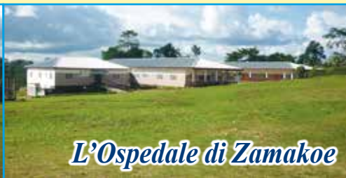
L'Ospedale di Zamakoe