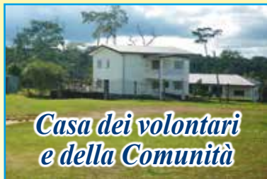
Casa dei volontari e della Comunità