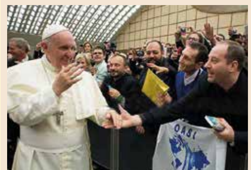
Gioioso incontro con Papa Francesco del 22 novembre 2014