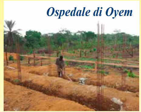
Ospedale di Oyem