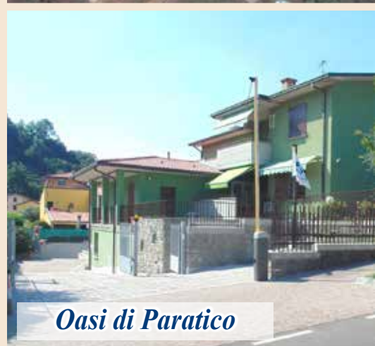
Oasi di Paratico