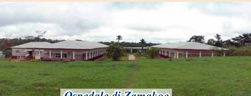
Ospedale di Zamakoe