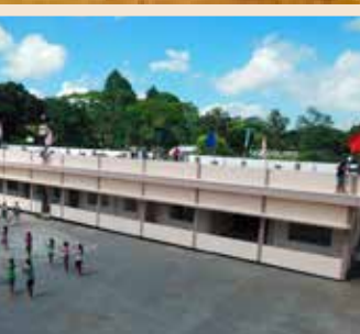
Ospedale di Umden