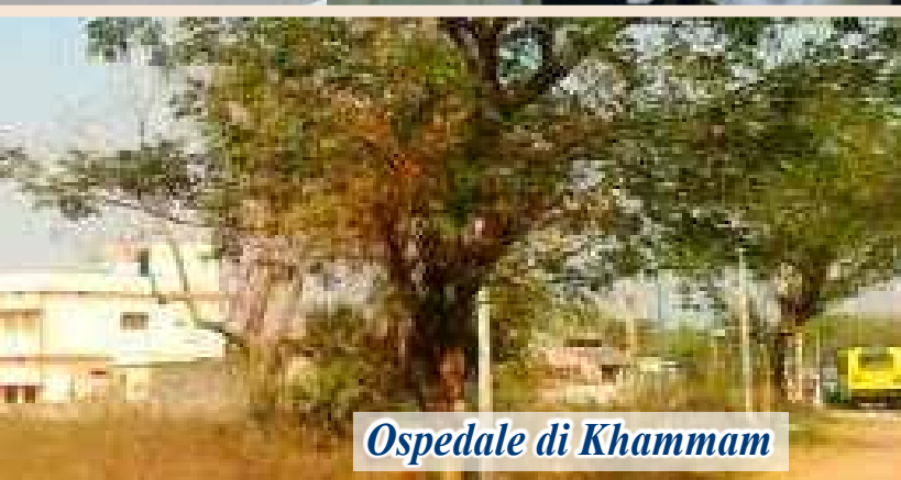
Ospedale di Khammam