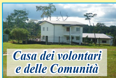
Casa dei volontari e delle Comunità