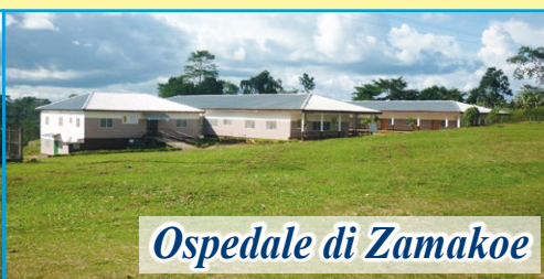
Ospedale di Zamakoe

Dopo la visita al nostro progetto da parte dei responsabili dell'Associazione (novembre 2021) sono stati confermati presso l'Ospedale “NOTRE DAME DE ZAMAKOE” tutti i progetti ed i servizi nati per i più poveri. Ogni giorno è garantita la presenza di medici per le consultazioni e le visite. Per il reparto di chirurgia è stato confermato il medico chirurgo che ormai lavora con noi da anni. Ogni mese sono decine ormai le operazioni chirurgiche. Il nostro impegno mensile per sostenere il progetto è di 1.500 euro necessari per il mantenimento della struttura (farmacia, stipendi del personale, attrezzature, manutenzioni ordinarie, ecc...). In questa zona dell'Africa sono poche, pochissime, le persone che possono lasciare qualche contributo durante la loro permanenza in Ospedale e, come sapete, in Africa non esiste il sistema nazionale sanitario o assicurazioni in caso di malattia. Aiutare questo Ospedale vuol dire salvare vite umane! Il vostro aiuto è fondamentale per la sopravvivenza di questa opera meravigliosa!