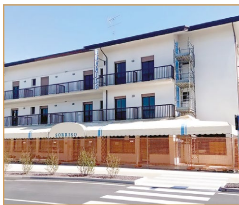
la struttura oggi...