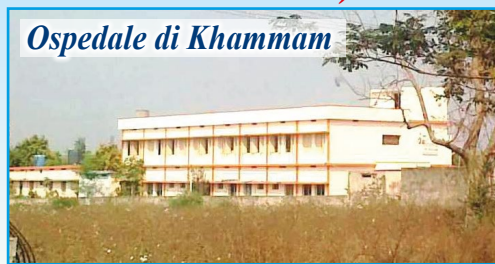
Ospedale di Khammam

In questo povero angolo dell'India, prosegue il nostro aiuto per la costruzione di pozzi d'acqua (ad oggi già scavati 40) e bagni a sostegno dei poveri villaggi della zona. In estate la temperatura arriva anche ai 45°C e la situazione diventa drammatica anche in campo sanitario. Ricordiamo che la somma necessaria per la realizzazione di un pozzo è di 500 euro e di un bagno di 250 euro . Con l'inaugurazione e l'apertura dell' Ospedale Pediatrico "DONO E CAREZZA DELLA MAMMA DELL'AMORE" nel villaggio di Morampally Banjara, dopo aver parlato con il Vescovo, l'associazione propone di " adottare a distanza " i bambini qui ricoverati (tutti sieropositivi o malati di AIDS) proprio per sostenere le spese di gestione, l'assistenza e le cure. Per ogni bambino sostenuto sarà richiesto un contributo annuale di almeno 190 euro .