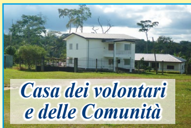
Casa dei volontari e delle Comunità