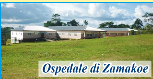
Ospedale di Zamakoe

Dopo la visita al nostro progetto da parte dei responsabili dell'Associazione (novembre 2021) sono stati confermati presso l'Ospedale "NOTRE DAME DE ZAMAKOE" tutti i progetti ed i servizi nati per i più poveri. Ogni giorno è garantita la presenza di medici per le consultazioni e le visite. Per il reparto di chirurgia è stato confermato il medico chirurgo che ormai lavora con noi da anni. Ogni mese sono decine ormai le operazioni chirurgiche. Il nostro impegno mensile per sostenere il progetto è di 1.500 euro