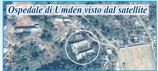
Ospedale di Umden visto dal satellite

La costruzione dell' Ospedale "MOTHER OF LOVE di UMDEN", realizzato al nord-est dell'India, è iniziata nel 2008 ed è stata inaugurata nell'ottobre 2017 con la presenza di Marco. Il costo per la costruzione si aggirava sui 225.000 euro . Ad oggi la nostra associazione ha mandato 195.000 euro. Grazie ad un accordo di fiducia reciproca, tra l'Ispezione dei Salesiani, le ditte locali e alcuni magazzini di materiali edili, siamo riusciti ad avere una dilazione nei pagamenti e quindi ultimare tutti i lavori. È ancora fondamentale il nostro sforzo nel contribuire alle spese fatte che vanno liquidate. Chi desidera può sempre sostenere questo impegno. La cosa importante è che ad oggi l'ospedale è stato ultimato ed è funzionante. Ogni giorno le suore ed il personale ricevono circa 200 pazienti come vedete nelle foto qui sotto.