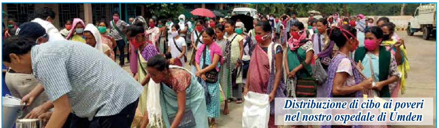
Distribuzione di cibo ai poveri nel nostro ospedale di Umden

Roma, San Giovanni in Laterano, 13 giugno 2020, Memoria liturgica di Sant'Antonio di Padova.