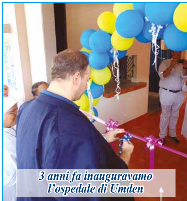
3 anni fa inauguravamo l'ospedale di Umden